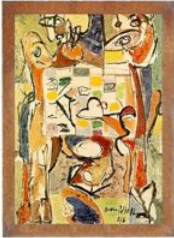
Jackson Pollock - The tea cup (1946)