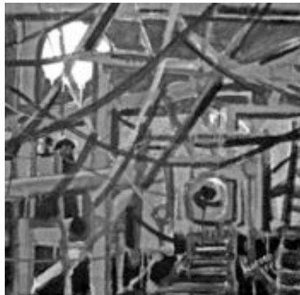
"Estaleiro Velrôme" Autor: Lucio Pegoraro Data: 1986 Acervo do autor.