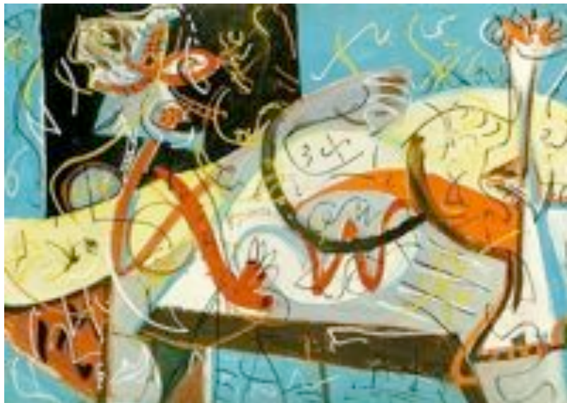
Jackson Pollock - Stenographic Figure (1942)