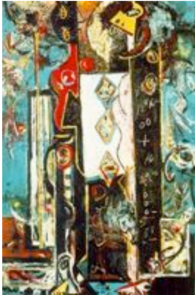
Male and Female - Jackson Pollock (1942)