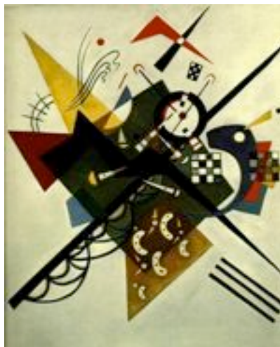
"Sobre o branco II", de Wassily Kandinsky (1923).