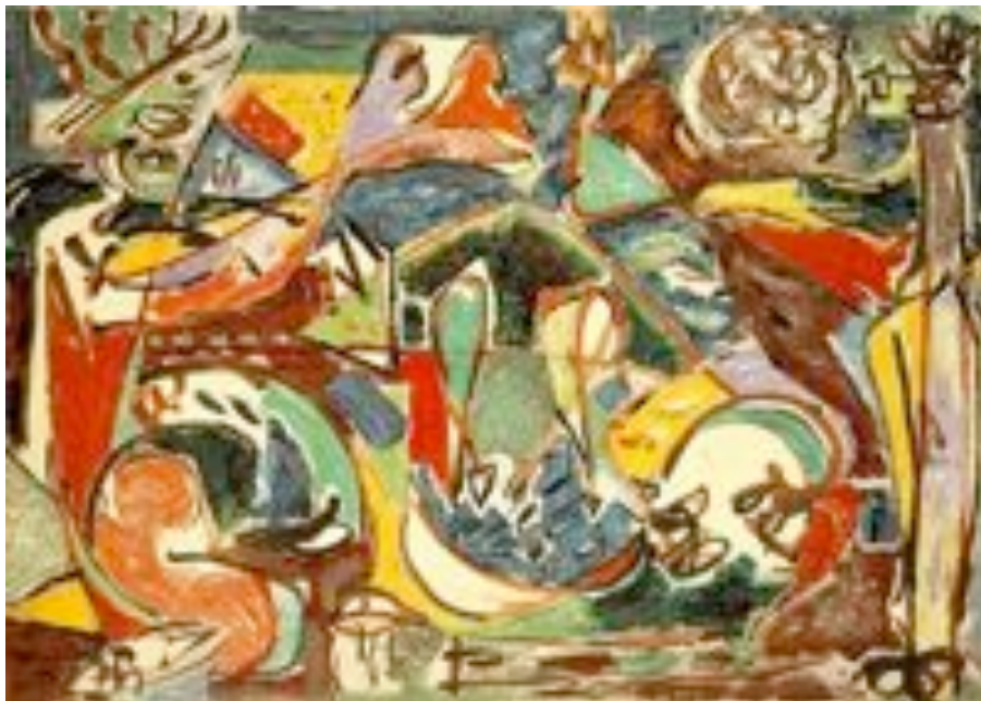
The Key - Jackson Pollock (1946)