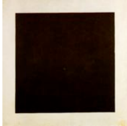
"Quadrado negro sobre fundo branco", de Kazimir Malévitch (1915).