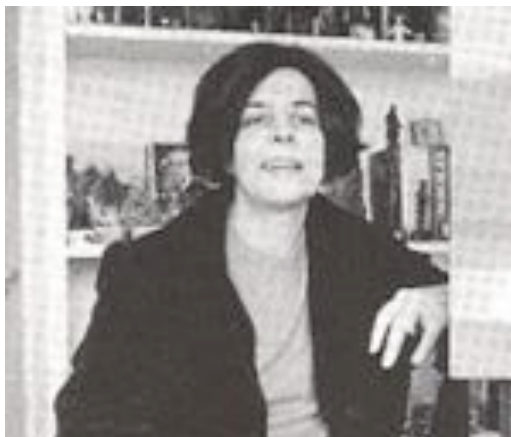
MARIA LEONTINA (1917 – 1984)

No Brasil, a arte abstrata ganhou força a partir da I Bienal de São Paulo (1951). Entre os artistas brasileiros de arte abstrata, podemos destacar: Antônio Bandeira, Maria Leontina, Ivan Serpa, Iberê Camargo, Manabu Mabe, Valdemar Cordeiro, Lúgia Clarck e Hélio Oiticica.