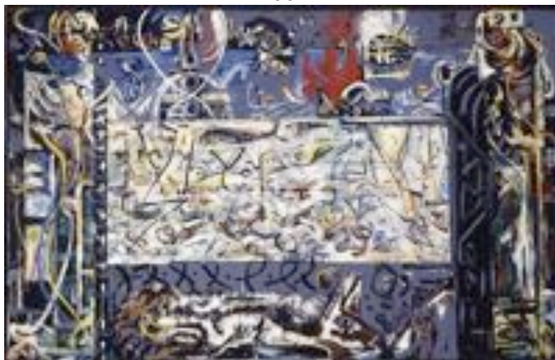
Tela, The Guardian of Secret - Jackson Pollock (1943)