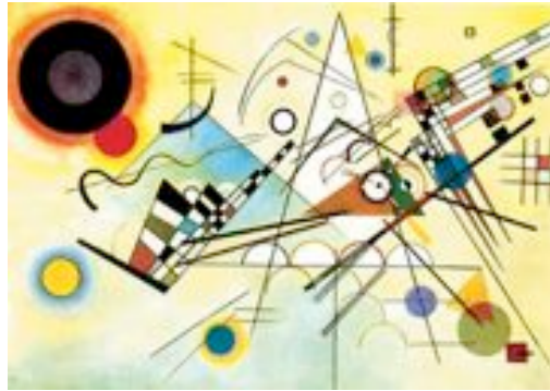
Kandinsky demonstra nas obras 'Composição VIII' o equilíbrio das formas geométricas, 1923